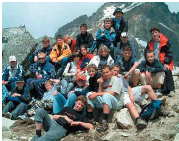
Žáci 8.třídy úspěšně zdolali Predné Solisko ve Vysokých Tatrách.

LUTEX s. r. o. Velkoobchod s textilem Nákup, výroba a prodej textilního zboží Dámské, pánské a dětské svetry