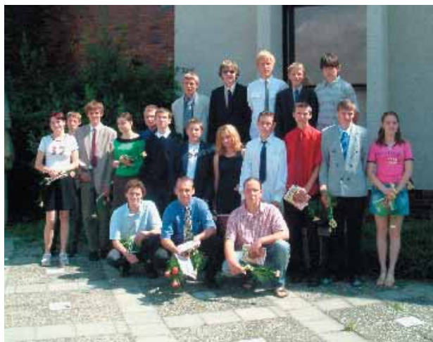
Absolventi naší školy v roce 2004.