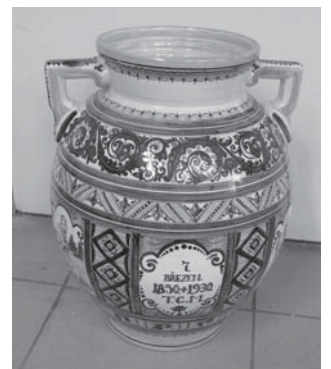
Dar prezidentu Masarykovi k 80. narozeninám